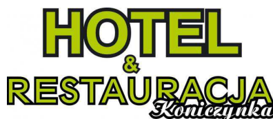
Hotel, Restauracja "Koniczynka" S. C.

Restauracja "Koniczynka" w Pawłowicach stawia do dyspozycji swoim gościom nową salę konsumpcyjną na 50 osób, salę weselną na 140 osób, salę bankietową oraz salonik hotelowy. Restauracja zapewni organizację bankietów, spotkań biznesowych, przyjęć okolicznościowych, wesel z noclegami, imprez rodzinnych czy też cateringu.