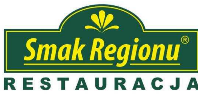
Restauracja "Smak Regionu"

Restauracja "Smak Regionu" w Pawłowicach to według plebiscytu Dziennika Zachodniego najlepszy Lokal Gastronomiczny w powiecie pszczyńskim i trzeci w województwie śląskim. Wystrój restauracji promuje ziemię pszczyńską i śląską. Niewątpliwym atutem restauracji jest tradycyjna kuchnia regionalna, śląska i polska.