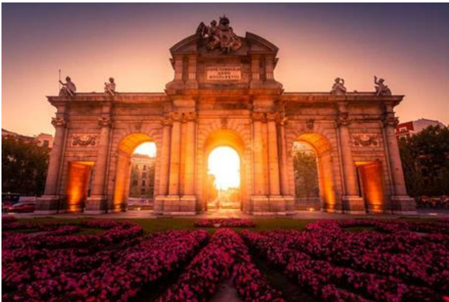
Puerta de Alcalá

Klasycystyczny pomnik znajdujący się na Plaza de la Independencia